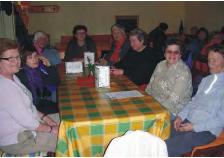
26.3. Rast auf dem Jakobsweg im Mostviertel