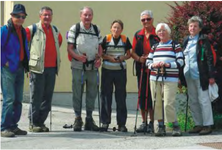
29.5. Fallerbucht am Sieberlbach