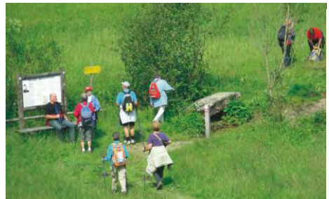
25.6. unterwegs am Silberbergweg