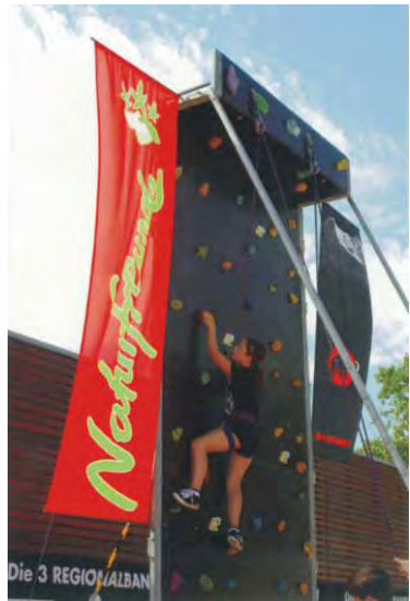
Unsere Kletterwand beim 1. Int. Tag der Jugend am 12.8.2011 in Amstetten.