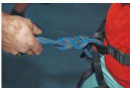
Kontrolle der Sicherung und der Protokolle