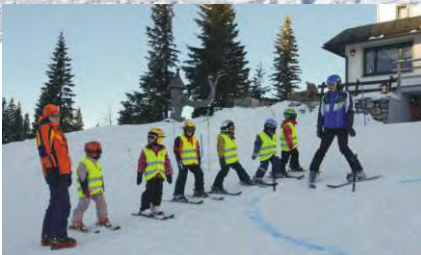
Kinderschikurs am Hochkar