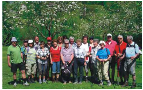
23.4. Blütenwanderung im Mostviertel