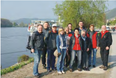
Bei der Landeskonferenz auf dem Raddampfer Schönbrunn und in Melk