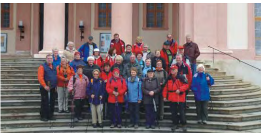
22.10. Abschlusswanderung Göttweg - Mammutbäume