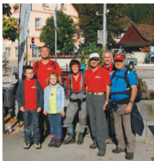
2011 waren wir in St. Aegydt am Neuwalde.

Wir freuen uns auf jede tatkräftige Mithilfe!