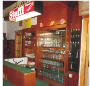
Die Schank in der Gaststube - alt und neu