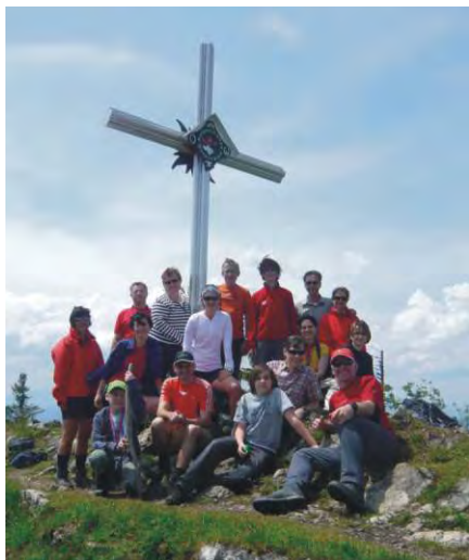
Auf dem Gipfel des Almkogels am Weltumwelttag 2011.

Gemeinsame Wanderwegsanierung im Gebiet Kleinreifling/Bodenwies in Zusammenarbeit mit dem Ortsbeirat Kleinreifling