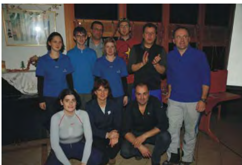
Das Schikurs-Betreuer team