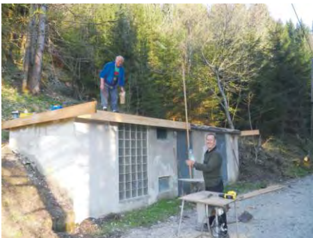
Das schadhafte Dach des Lagerraumes (ehem. Generatorraum) wurde abgedichtet.