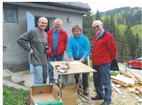
Besuch von Landesgeschäftsführer und Landeshüttenreferenten.