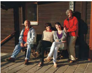
Schikurstreffen auf der Sonnrißhütte