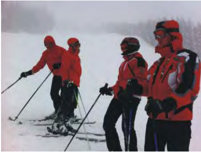
Skiopening und Après Ski in Schladming