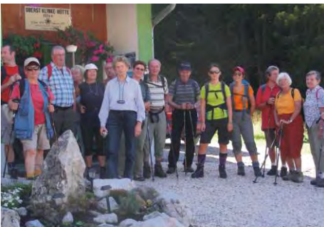
3.9. Oberst Klinke-Hütte - Lahnganggipfel